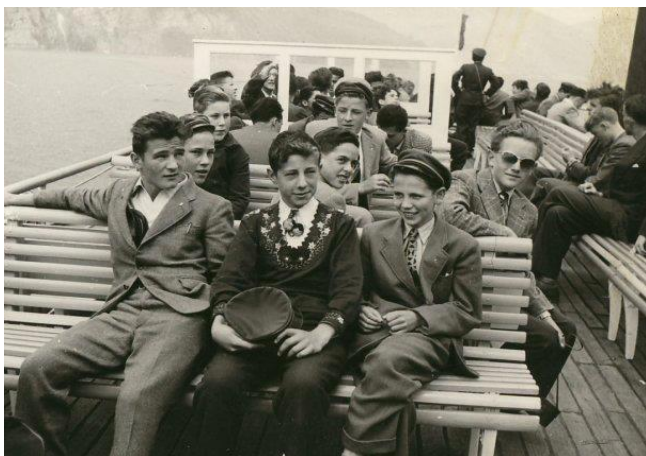
Une excursion du collège en 1956 avec un bateau à vapeur Peut-être que Paul était aussi sur le bateau...