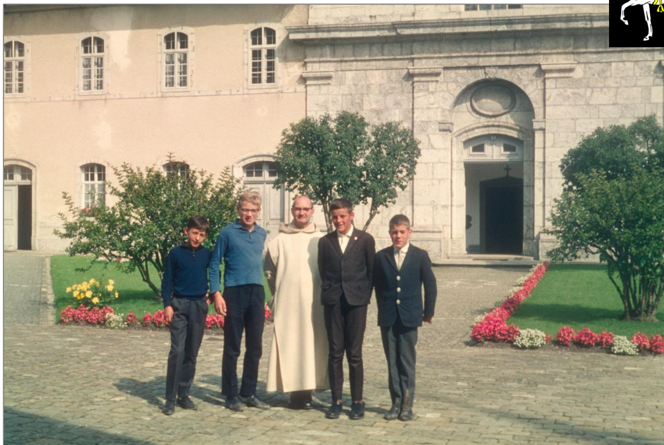
Devant le monastère de la Valsainte