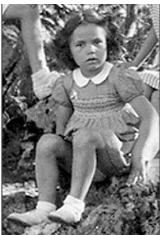
Roselyne à 3 ans

Son diplôme obtenu, elle trouve du travail à Milan dans la succursale de Ciba, grâce à sa sœur de Lugano. Elle intègre le département graphisme qui est dirigé par un Suisse allemand.