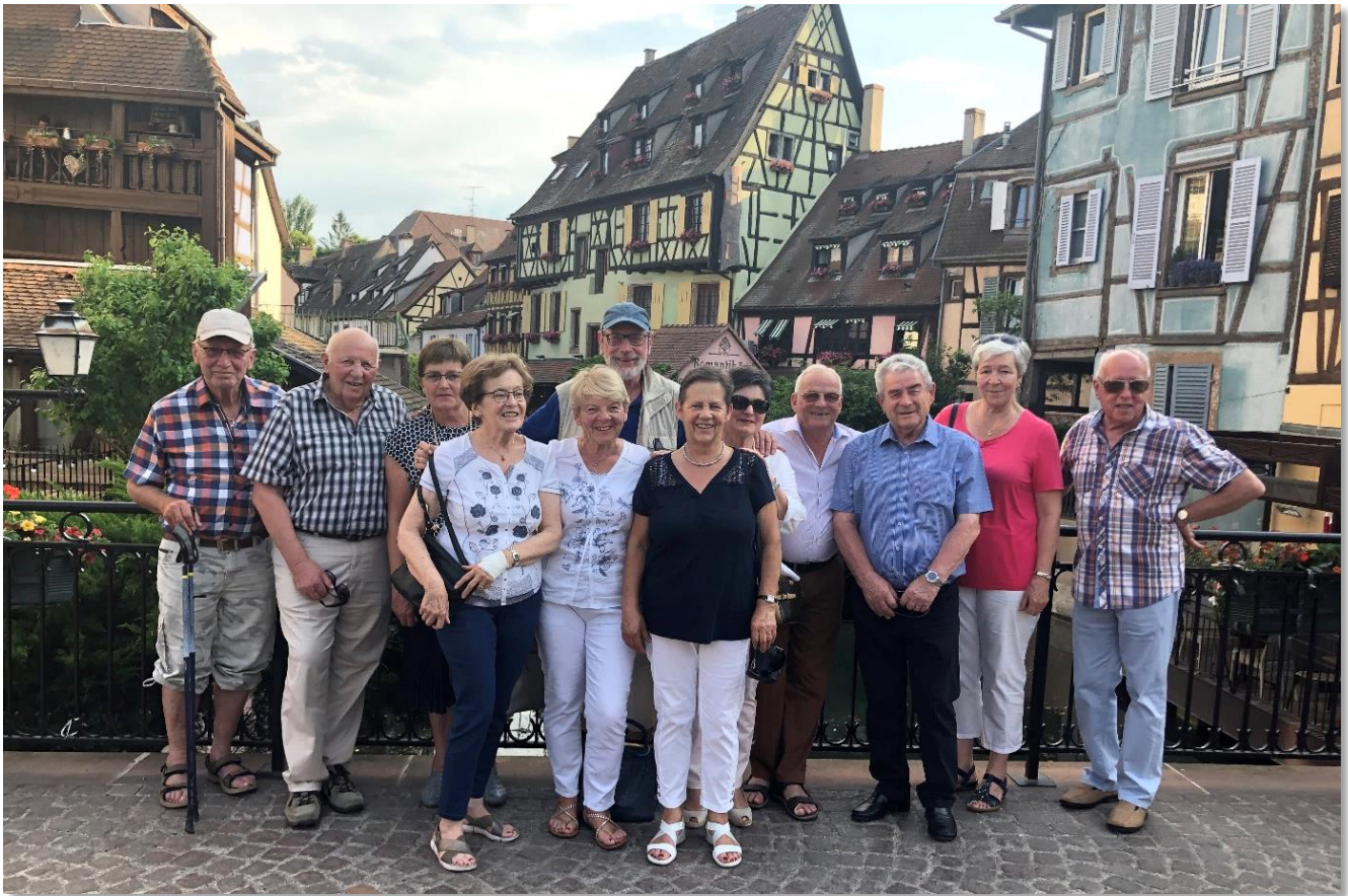
A Colmar

Au deuxième jour, ce fut Strasbourg, métropoles des Alsaciens, ville séparée par le Rhin, un pied sur hier, un sur demain. Ses murs ont deux mille ans d'histoire et sa cathédrale gothique s'illumine dans la nuit noire. Juste au coucher du soleil, la ville n'est plus qu'or et lumière. Ses monuments, ses anciens ponts couverts sont de pures merveilles.