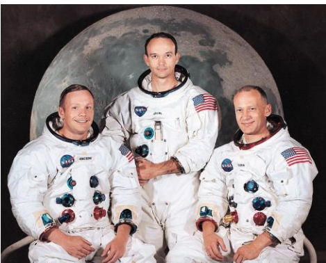
Neil Armstrong, Michael Collins et Edwin Aldrin

Les 3 cosmonautes étaient partis le 16 juillet avec la mission Apollo 11, à bord d'une fusée Saturn V. Armstrong et Aldrin sont restés environ 2h½ sur le sol lunaire. Douze astronautes ont marché sur la Lune, du 21 juillet 1969 au 11 décembre 1972. Gene Cernan est le dernier homme à poser le pied sur la Lune. Aux USA on les appelle les moon-walkers . En 2019, soit 50 ans après le premier débarquement sur la Lune, ils ne sont plus que quatre encore en vie : Aldrin, Scott, Duke et Schmitt.