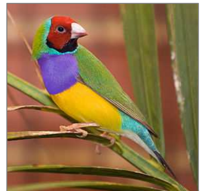
Gould Amandine / Amadine (Wikipedia)

Als Geschenk seiner Kinder durfte er bereits eine gemeinsame Fahrt in der Region in einer weissen Stretch-limousine geniessen. Bereits am vergangenen Samstag, den 9. April, haben Verwandte und Nachbarn anlässlich einer "Offenen Tür" den Jubilar gefeiert. Unsere besten Wünsche zu seinem Geburtstag am 12. April.