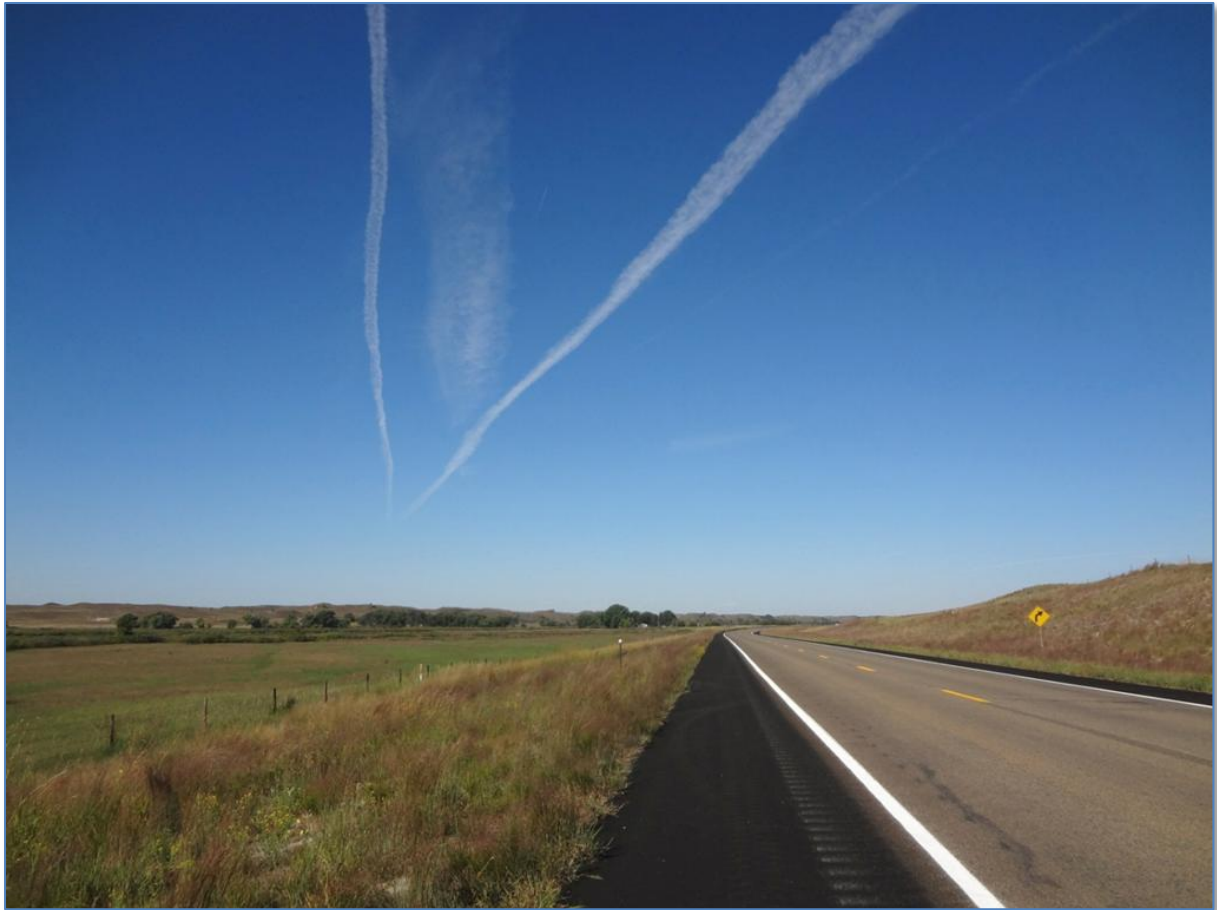
Une scenic byway dans la région

Irène a collaboré occasionnellement par le passé à la Photo de la Semaine. En 2014 elle a voyagé pendant 8 semaines aux Etats-Unis et rencontré des gens de tous milieux, qu'elle nous fera découvrir dans de futurs articles. (MJ)