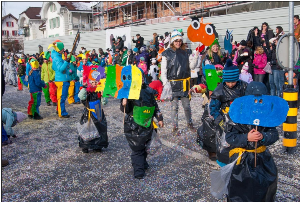
... et les « Petits Monstres » des classes 3-4H

Deux autres groupes, « Les Sorciers et Sorcières », Classe 1-2 H et « Les Bouffons », Classe 5-6 H faisaient partie du cortège. (MJ)