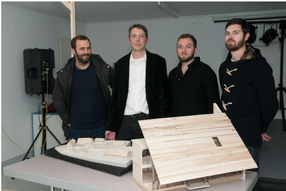
Photo : Quatre des collaborateurs du bureau LVPH architectes Sàrl / 22.11.2013

Le vernissage de l'exposition a eu lieu vendredi 22 novembre, dans la salle multimédia de l'école où tous les projets sont exposés du 23.11 au 1.12.2013. Les dates et heures d'ouverture sont consultables sur www.cressier.ch , lien direct : Affiche .